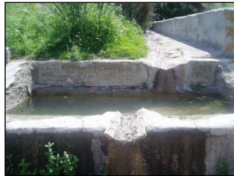
Fuente del Fontarrón