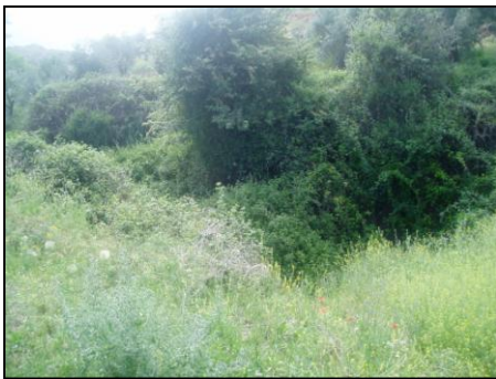
Fuente Colmenar de los Cucos

Se plantea esta actuación dentro del Plan Turístico “Montes Orientales” debido a que el sendero que une peatonalmente Deifontes con su Atalaya se encuentra en mal estado de conservación y sin ningún tipo de señalización. El atractivo que tiene este sendero, además del contenido paisajístico por el mirador panorámico que es la Atalaya de Deifontes, se encuentra en los tres manantiales que nos encontramos en su desarrollo: La fuente de la Salud, La Fuente del Colmenar de los Cucos o del Carbonato en la Umbría del Barrancaral y el Fontarrón.